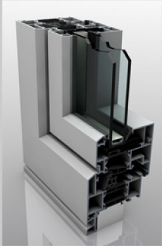
Standaard: 1,9 W/m 2 .K